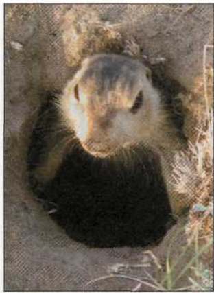
Детёныш жёлтого суслика осторожно выглядывает из норы.

циального прибора (сканера), затем зверька взвешивали, помещая на электронные весы в матерчатом мешочке, и выпускали обратно, в его собственную нору. Таким образом, возраст, вес и пол каждого животного были известны.